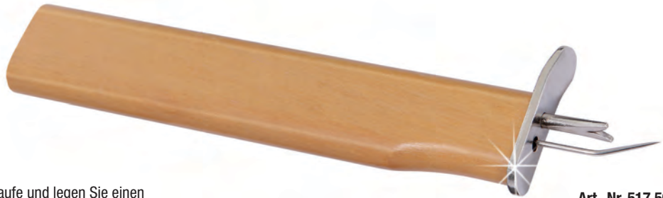
Art.-Nr. 517 508

Äußerst praktisches Handwerkzeug, um professionell und schnell Perlseiden zu Knoten. Mit diesem Werkzeug lassen sich sogar kleinste Knoten direkt am Stein oder an der Perle anbringen. Gute Qualität, Handgriff aus Holz. Gesamtlänge: 140 mm.